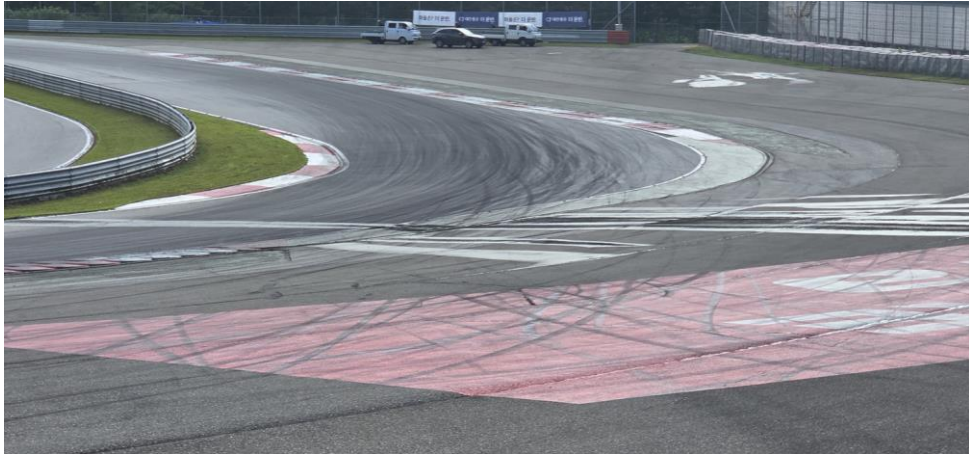
T2.3 L - 트랙 바깥쪽에 물 흐름