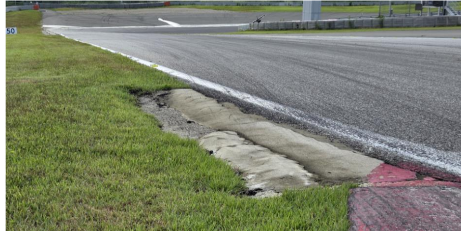
T15.0 L - 연석 후 흙 패임